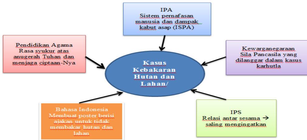
Gambar 3.2 Rekomendasi Analisis Kasus Karhutla dengan Melibatkan Mata Pelajaran Terkait

Berdasarkan hasil validasi tersebut, peneliti mencermati kembali materi simakan yang dibuat. Setiap sub tema diusahakan dihubungkan dengan kearifan lokal Sumatera Selatan. Dengan demikian, rekomendasi konten materi simakan dapat dilihat pada tabel berikut,